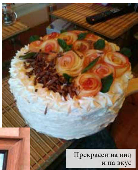
Прекрасен на вид и на вкус