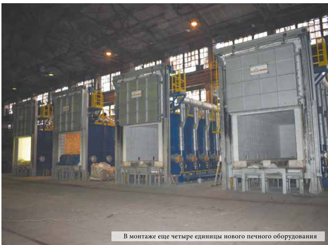
В монтаже еще четыре единицы нового печного оборудования

С приходом весны цех включился в работу по уборке закрепленных территорий и подготовке к месячнику по благоустройству, который будет проходить на предприятии в апреле.