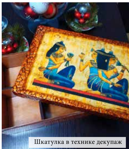
Шкатулка в технике декупаж