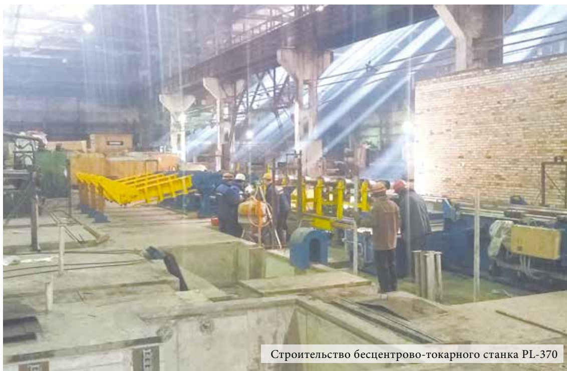
Строительство бесцентрово-токарного станка PL-370

С началом весны на адьюстаже комбината — в цехе отделки металлопроката — стартовал новый виток работ по техническому перевооружению и обновлению производственных мощностей. О весеннем движении в ЦОМП — в нашем следующем материале.