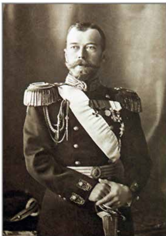
Его Императорское Величество, самодержец Всероссийский Николай II