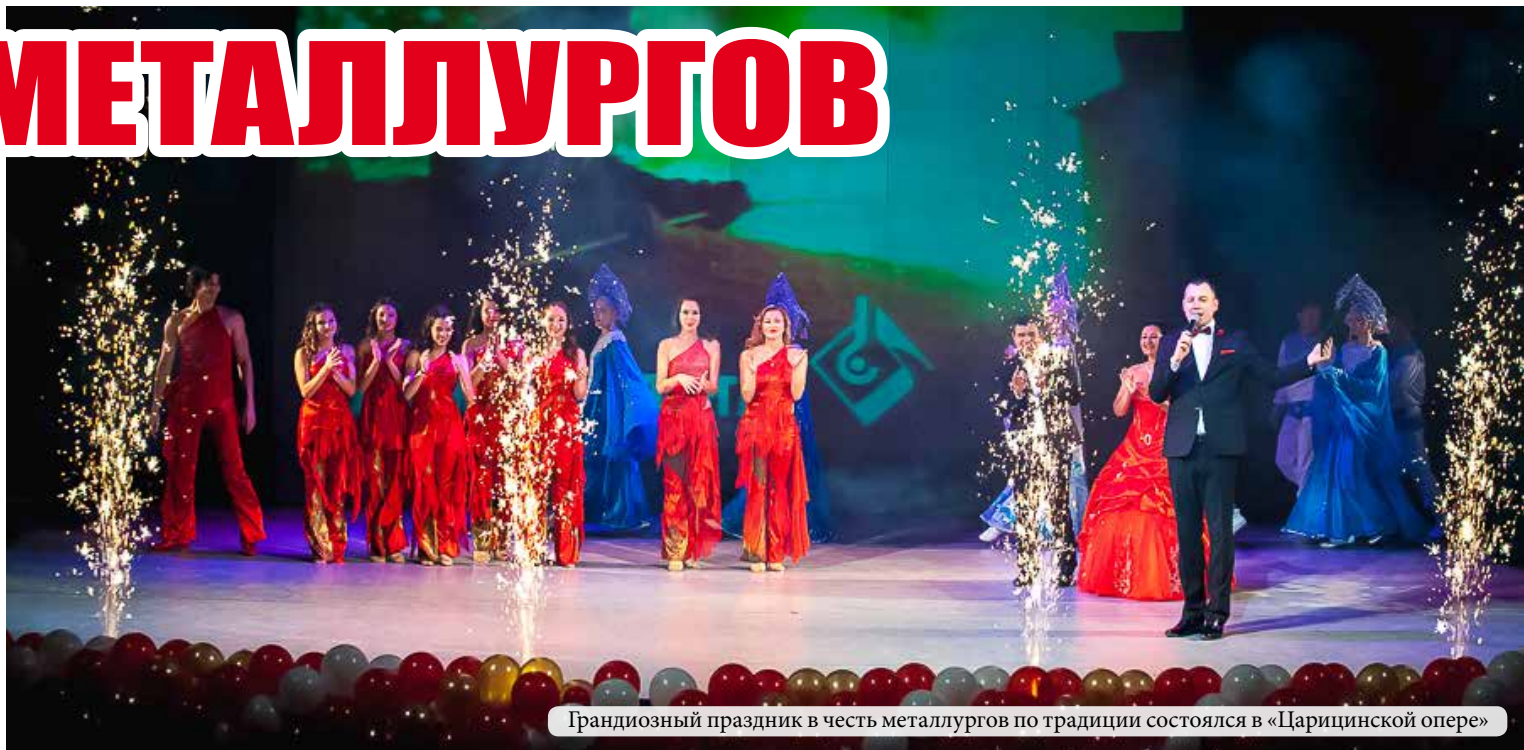
Грандиозный праздник в честь металлургов по традиции состоялся в «Царицынской опере»

14 июля предприятия «Красный Октябрь» отметили новый металлургический год — День металлурга! В этот день 60 работников комбината и завода были отмечены за свои профессиональные заслуги грамотами и наградами.