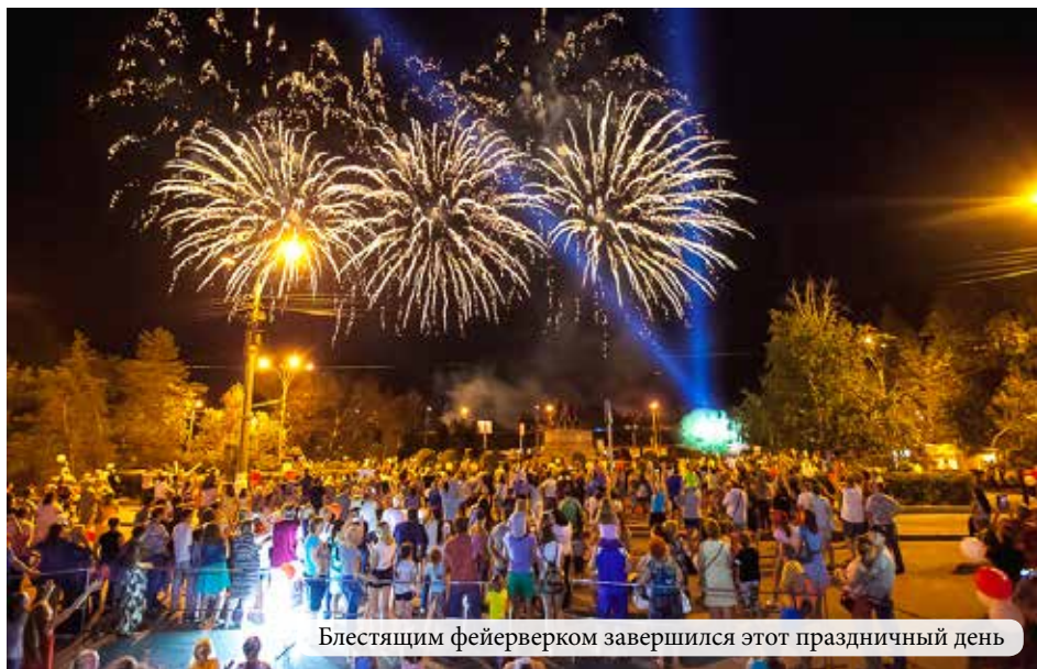
Блестящим фейерверком завершился этот праздничный день

На интерактивных площадках, где особую активность проявляли не только дети, но и взрослые, можно было сделать аквагрим, занять очередь среди желающих получить свой шарж от профессионального художника, сфотографироваться с тематическими тантамаресками, посмотреть на волшебные номе-