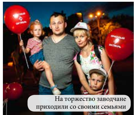
На торжество заводчане приходили со своими семьями

ра фокусника и принять участие в шоу мыльных пузырей. Для любителей подарков работали спортивно-позитивно-развлекательные площадки с «надувными» волейболом и футболом, игровым сумо, дорожками для гольфа разной степени сложности и многое другое. Самые ловкие и меткие получали жетоны, которые можно было обменять на ручки, значки, брелки, бейсболки, кружки, календа-