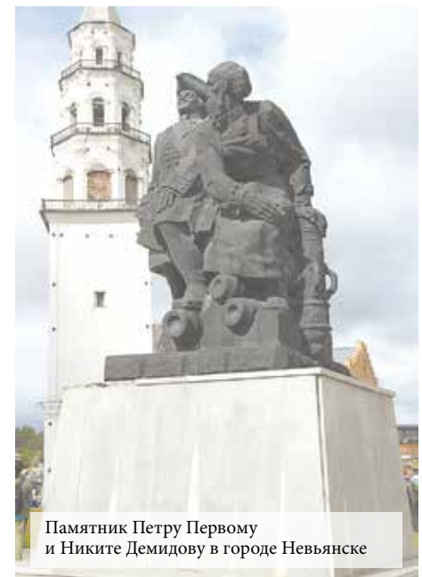
Памятник Петру Первому и Никите Демидову в городе Невьянске

Никита Демидов обладал феноменальной памятью, лично вникал во все детали заводского хозяйства. Он проявлял «рев-