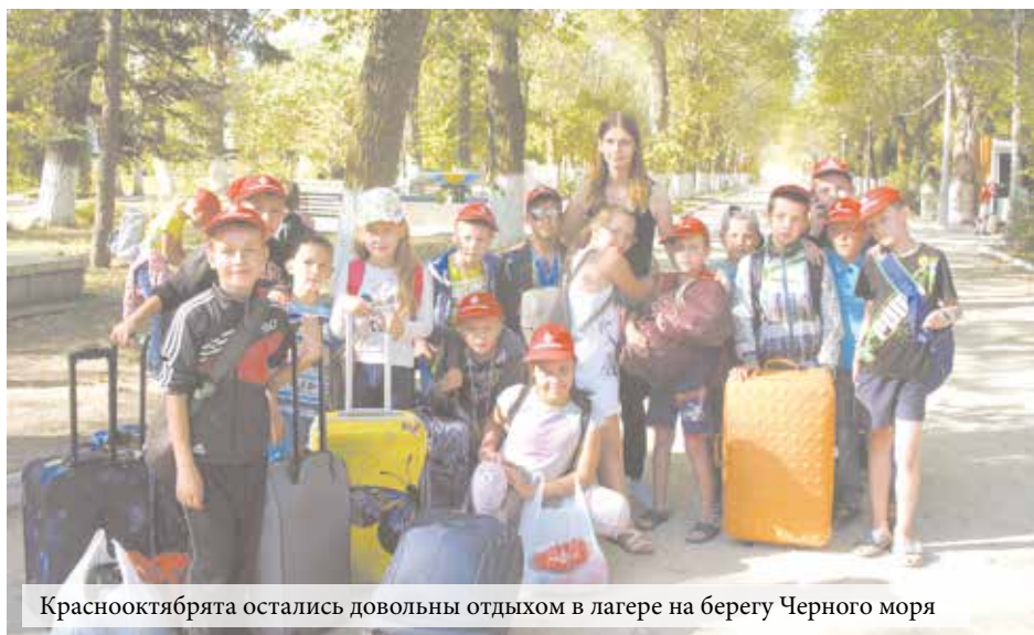
Краснооктябрята остались довольны отдыхом в лагере на берегу Черного моря