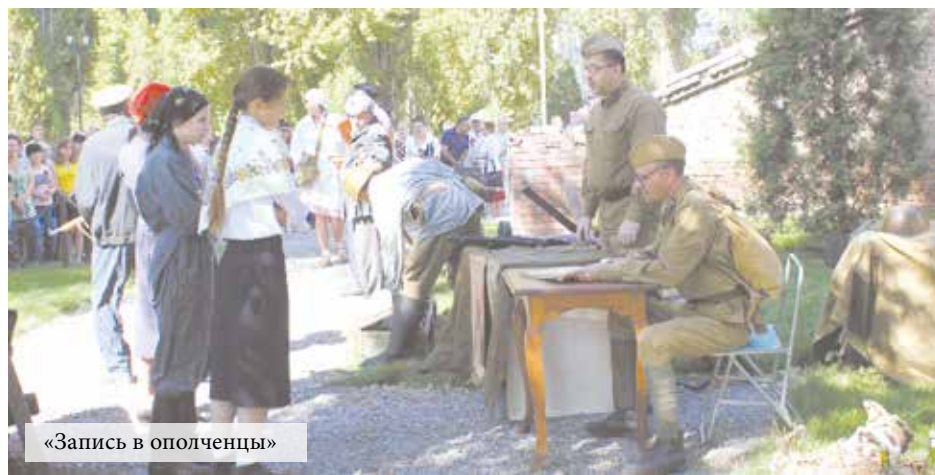
«Запись в ополченцы»