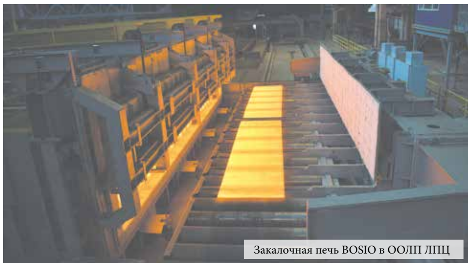
Закалочная печь BOSIO в ООЛП ЛПЦ

21 октября 1967 года Центральный Комитет КПСС, Президиум Верховного Совета СССР, Совет Министров СССР и Всесоюзный Центральный Совет профессиональных союзов наградили памятным Знаменем трудовой коллектив металлургического завода «Красный Октябрь» — победителя социалистического соревнования по Волгоградской области, проходившего в честь 50-летия Великой Октябрьской Социалистической революции. С тех пор Знамя хранится в музее истории завода.