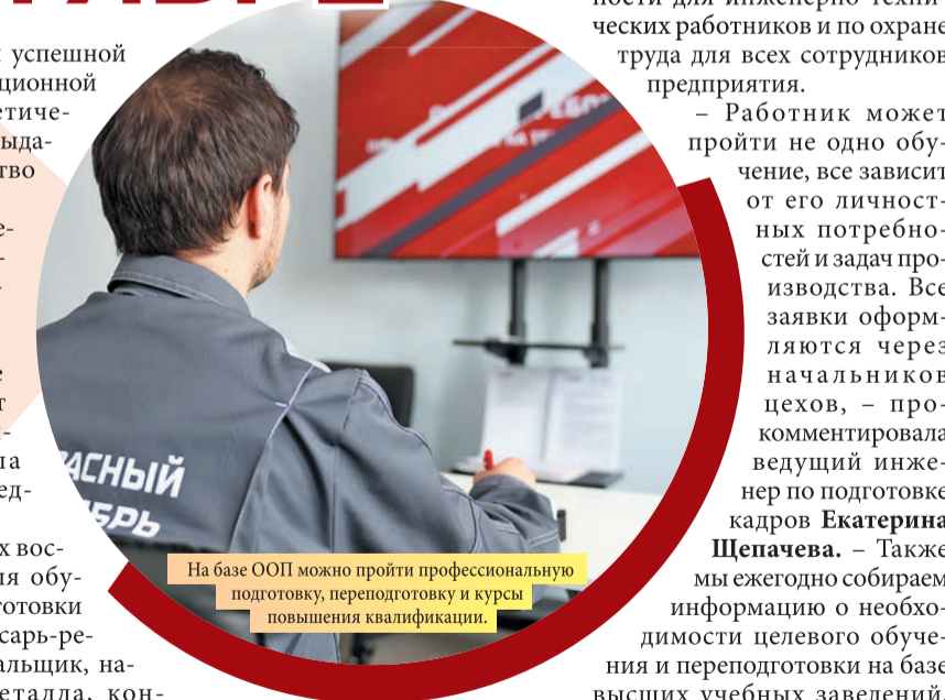
На базе ООП можно пройти профессиональную подготовку, переподготовку и курсы повышения квалификации.

В списке самых востребованных для обучения и переподготовки профессий – слесарь-ремонтник, стропальщик, нагревательщик металла, контролер в производстве черных металлов, электромонтер и обработчик поверхностных пороков металла.