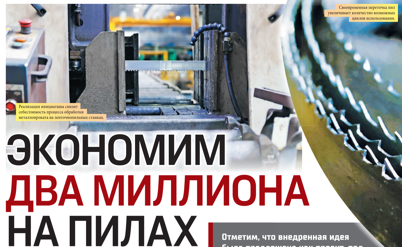
Реализация инициативы снижает себестоимость процесса обработки металлопроката на ленточнопильных станках.

На металлургическом заводе внедрена инициатива, направленная на продление жизненного цикла ленточных пил. Реализация проекта позволит снизить себестоимость процесса обработки металлопроката на ленточнопильных станках, используемых в электросталеплавильном цехе № 3 и цехе отдели металлопроката.