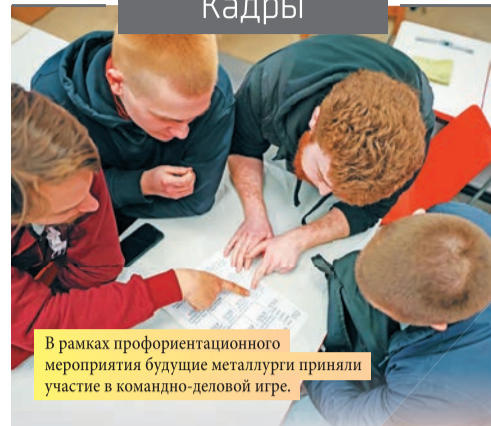
В рамках профориентационного мероприятия будущие металлурги приняли участие в командно-деловой игре.