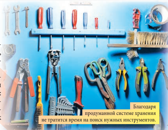
Благодаря продуманной системе хранения не тратится время на поиск нужных инструментов.

В 2024 году организовано пространство в отделении по изготовлению металлоконструкций. Работники участка установили несколько стеллажей для проверки форсунок топливного насоса высокого давления, ремонта гидросистем уплотнения, хранения слесарных ключей и другого инструмента.