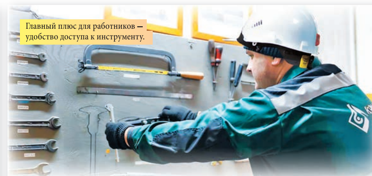
Главный плюс для работников – удобство доступа к инструменту.

Мы побывали в нескольких подразделениях и поговорили с сотрудниками, активно использующими инструменты 5S+1 в своей работе.