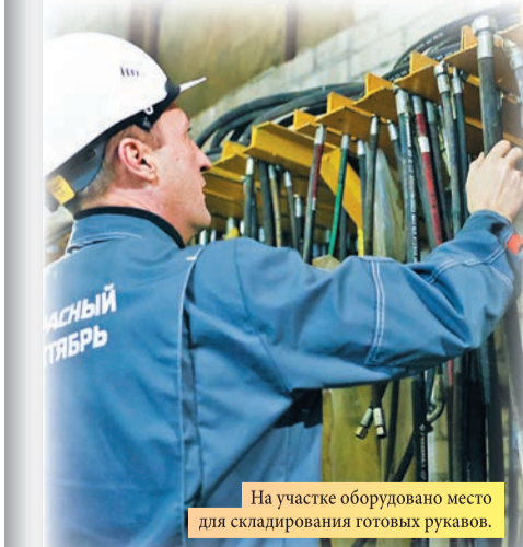
На участке оборудовано место для складирования готовых рукавов.

сделали стеллажи для размещения инструментов и защитных очков, отремонтировали шкафы. Непосредственно на рабочем столе разместили паяльную станцию для ремонта сварочного оборудования. – На мероприятии по эффективной организации пространства у нас ушло около недели – это с учетом основной занятости. Большой плюс метода 5S+1 в том, что все можно сделать своими руками, без лишних затрат, и в итоге получить быстрый и наглядный результат, – рассказал электрик ЦРМО Саид Идолбаев.