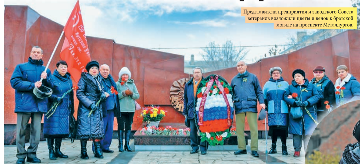
Представители предприятия и заводского Совета ветеранов возложили цветы и венок к братской могиле на проспекте Metallurgov.