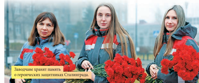
Заводчане хранят память о героических защитниках Сталинграда.