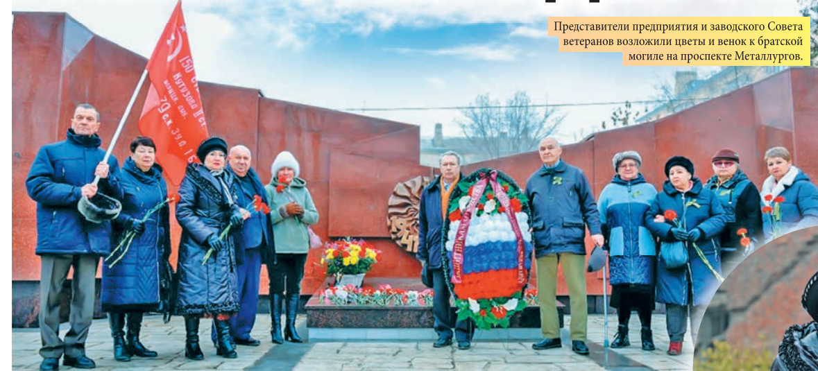
Представители предприятия и заводского Совета ветеранов возложили цветы и венок к братской могиле на проспекте Металлургов.