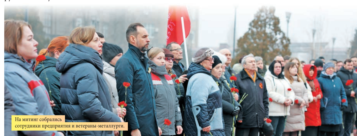
На митинг собрались сотрудники предприятия и ветераны-металлурги.