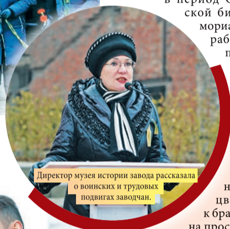
Директор музея истории завода рассказала о воинских и трудовых подвигах заводчан.