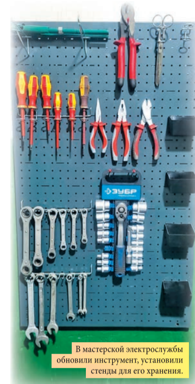
В мастерской электрослужбы обновили инструмент, установили стеллажи для его хранения.

В начале 2024 года применили принципы 5S+1 в помещении мастерской электрослужбы. Специалисты восстановили рабочую зону, стол, обновили инструмент, установили стеллажи для его хранения. Также смонтированы стеллажи для размещения материалов. – Витюге получилось удобное рабочее место, которое персонал электрослужбы оборудовал под свои потребности. Все необходимое находится в открытом доступе. Также старались применить методы визуализации, например, для наглядности метизные изделия распределены по сортам и размерам, что, безусловно, упрощает задачу при подборе необходимой детали, – прокомментировал электрик участка Сергей Максумов.