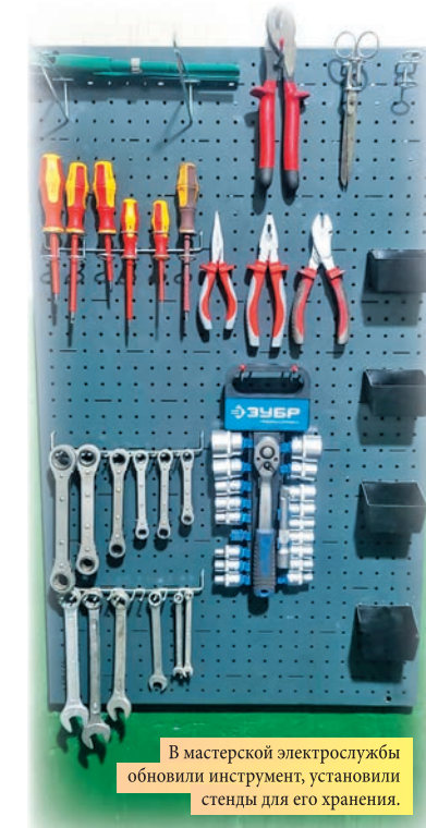
В мастерской электрослужбы обновили инструмент, установили стеллажи для его хранения.

В начале 2024 года применили принципы 5S+1 в помещении мастерской электрослужбы. Специалисты восстановили рабочую зону, стол, обновили инструмент, установили стеллажи для его хранения. Также смонтированы стеллажи для размещения материалов. – Витюге получилось удобное рабочее место, которое персонал электрослужбы оборудовал под свои потребности. Все необходимое находится в открытом доступе. Также старались применить методы визуализации, например, для наглядности метизные изделия распределены по сортам и размерам, что, безусловно, упрощает задачу при подборе необходимой детали, – прокомментировал электрик участка Сергей Максумов.