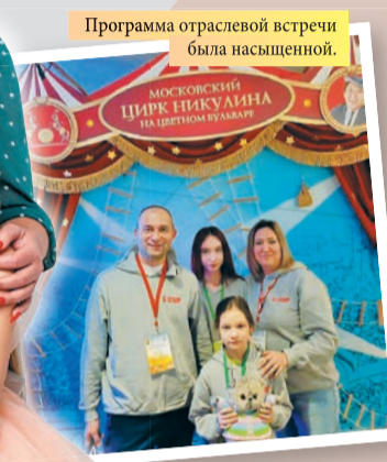
Программа отраслевой встречи была насыщенной.