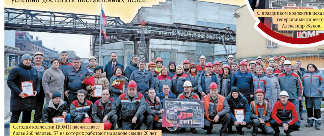
Сегодня коллектив ЦОМП насчитывает более 260 человек, 57 из которых работают на заводе свыше 20 лет.