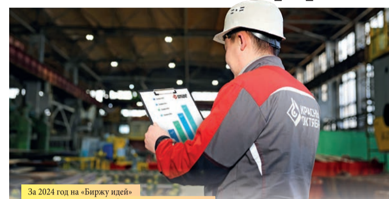
За 2024 год на «Биржу идей» от заводчан поступило более 8500 предложений.

Основная часть инициатив направлена на улучшение условий и безопасности труда – поряд-