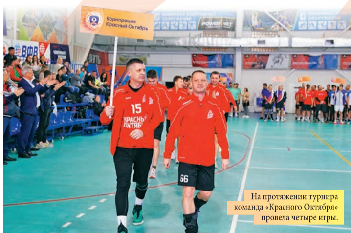
На протяжении турнира команда «Красного Октября» провела четыре игры.

«Красный Октябрь» стал бронзовым призером турнира по волейболу. По итогам соревнований, которые ежегодно проходят в преддверии Нового года, сборная «Красного Октября» заняла третье место среди 12 команд промышленных предприятий, профильных вузов и служб региона.