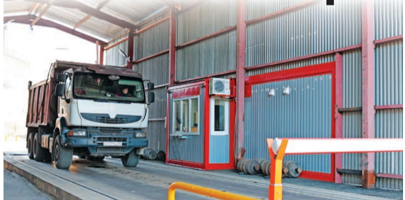
Благодаря изменению локации весового комплекса процедура взвешивания и выгрузки автотранспорт с металлоломом теперь проходит в одном месте.

Дополнительно около весового комплекса организована стоянка для прибывшего транспорта, оживающего взвешивание и выгрузку. – В результате проведенных мероприятий исключено скопление автомобилей в очереди на всех ключевых точках маршрута, минимизировано