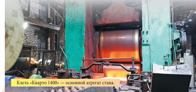
Клеть «Кварто 1400» – основной агрегат стана.

Напомним, что в рамках реализации ремонтной программы в прошлом году были проведены комплексные работы и в основном крупносерийном цехе: на станах 1000/850/630 и 1150. В этом году также запланированы ремонтные мероприятия основных прокатных и обрабатывающих агрегатов предприятия.