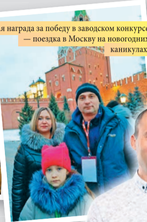
Главная награда за победу в заводском конкурсе — поездка в Москву на новогодних каникулах.

ма: поездка на Кремлевскую елку, посещение центра «Космонавтика и авиация» на ВДНХ и цирка Никулина на Цветном бульваре, обзорная экскурсия по Москве. Также они приняли участие в различных творческих