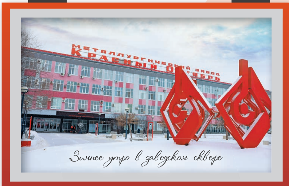
Зимнее утро в заводском сквере