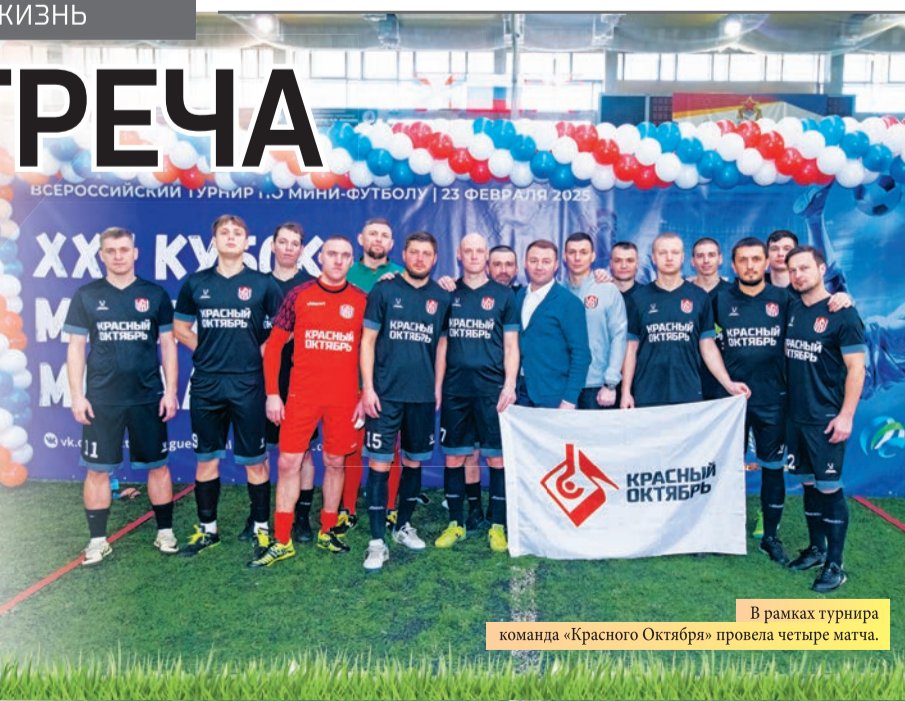
В рамках турнира команда «Красного Октября» провела четыре матча.

Для футболистов «Красного Октября» спортивный сезон только начинается – впереди несколько крупных состязаний: турнир Объединенной футбольной лиги, межотраслевая спартакиада, организруемая областным Советом профсоюзов, межзаводской турнир за кубок Горно-металлургического профсоюза России.