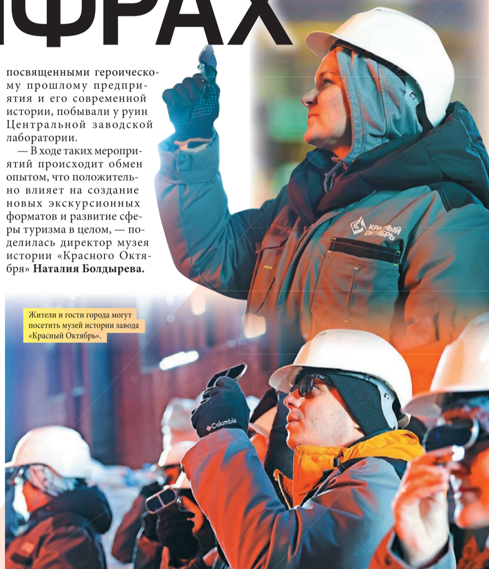
Жители и гости города могут посетить музей истории завода «Красный Октябрь».