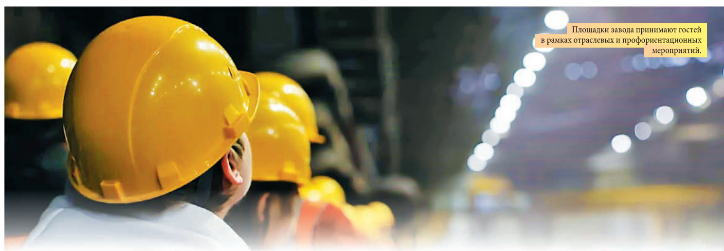
Площадки завода принимают гостей в рамках отраслевых и профориентационных мероприятий.

– Развитие направления промышленного туризма открывает новые перспективы для