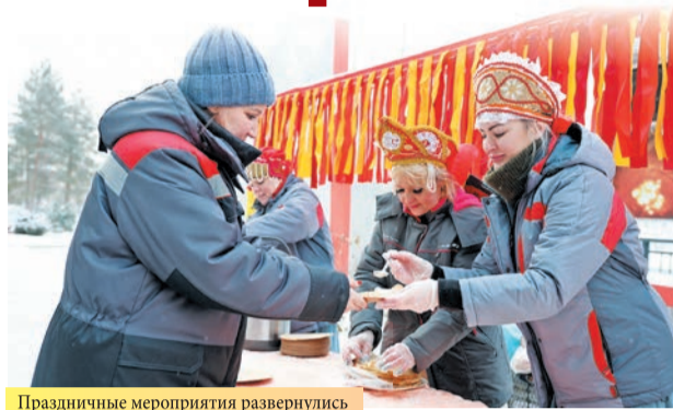
Праздничные мероприятия развернулись у пешеходной эстакады.

П о сложившейся традиции на «Красном Октябре» отметили Масленицу. В первый день масленичной недели заводчан встречали с блинами и самоваром. Традиционное блюдо в честь праздника приготовили повара предприятия. Также во время обеденного перерыва блинами можно было угоститься во всех столовых на территории завода.