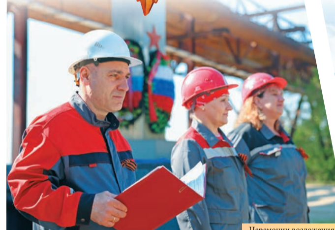
Церемония возложения венков и цветов – неотъемлемая часть памятных мероприятий, приуроченных к 9 Мая.

посетили тематическую экскурсию в музей истории завода, где узнали о вкладе коллектива предприятия в долгожданную Победу.