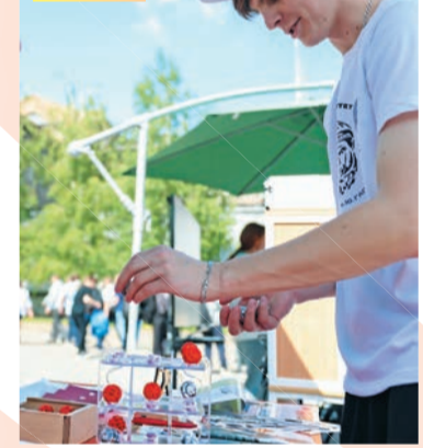
В рамках мероприятия для гостей работали профориентационные площадки.