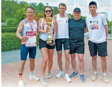
Команда «Металлурги» стала первой в марафонской эстафете.