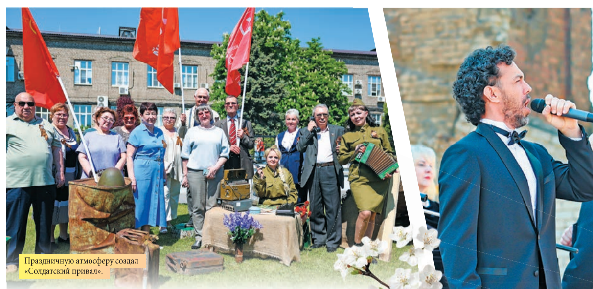
Праздничную атмосферу создал «Солдатский привал».

Завершился митинг минутой молчания и церемонией возложения венка и цветов к руинам ЦЗЛ с участием роты Почетного караула. В мероприятии участвовали и будущие металлурги – студенты Волгоградского колледжа управления и новых технологий имени Юрия Гагарина и Волгоградского технического колледжа. Кроме того, они