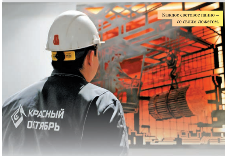
Каждое световое панно – со своим сюжетом.

В отделении по изготовлению металлоконструкций цеха по ремонту металлургического оборудования (ЦРМО) открылся после обновления зал сменно-встречных собраний.