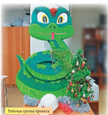
Рабочая группа проекта