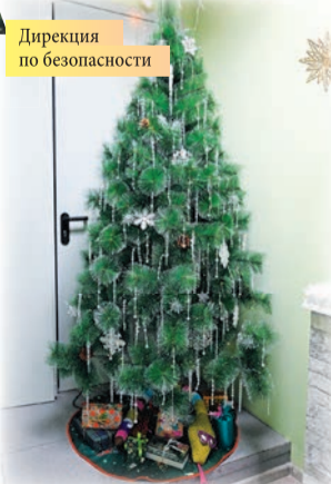
Дирекция по безопасности