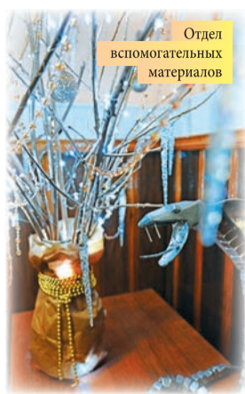
Отдел вспомогательных материалов