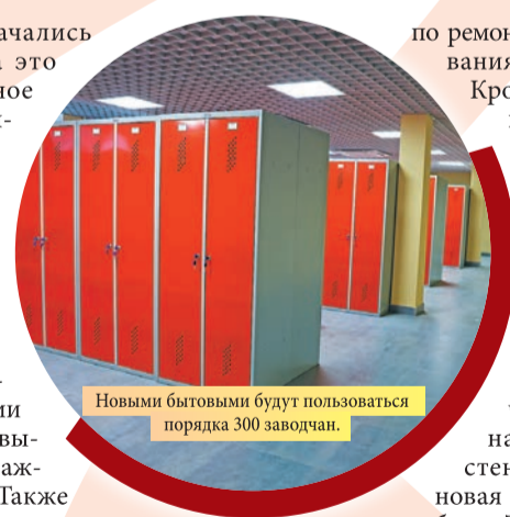
Новыми бытовыми будут пользоваться порядка 300 заводчан.

Отметим, что обеспечение безопасных и комфортных условий труда – приоритетная задача, стоящая перед руководством предприятия. В рамках реализации программы развития помимо административно-бытовых комплексов на «Красном Октябре» обновляются и цеховые помещения, благоустраивается заводская территория.