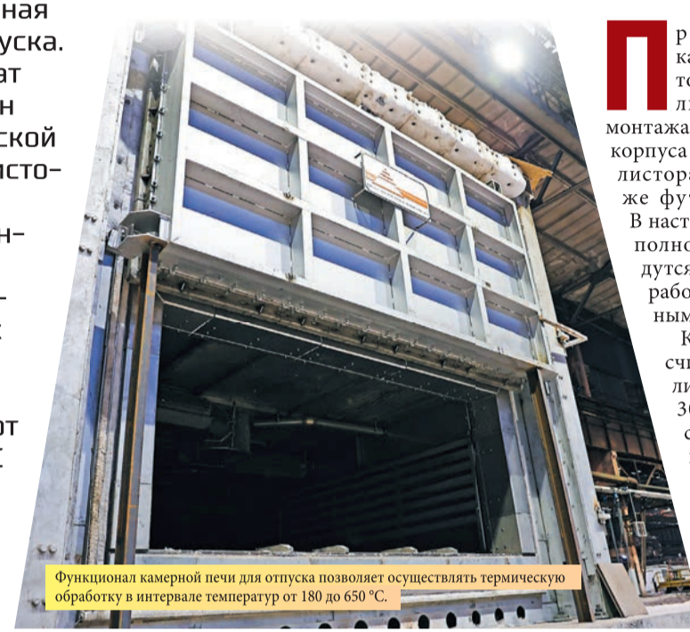
Функциональная камерная печь для отпуска позволяет осуществлять термическую обработку в интервале температур от 180 до 650 °С.

На термическом участке цеха отделки листового проката (ЦОЛП) готовится к вводу в эксплуатацию камерная печь для отпуска. Новый агрегат предназначен для термической обработки листового проката конструкционных, легированных и высокопрочных марок стали в интервале температур от 180 до 650 °С и обеспечит увеличение объемов производства.