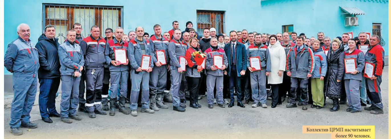
Коллектив ЦРМП насчитывает более 90 человек.