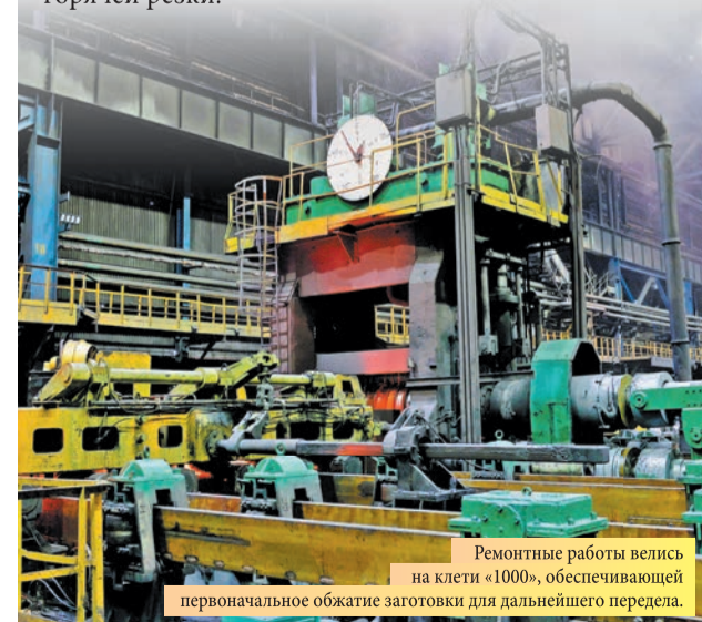
Ремонтные работы велись на клети «1000», обеспечивая первоначальное обжатие заготовки для дальнейшего передела.

Отметим, что это первый масштабный ремонт стана 1000/850/630 за последние 18 лет. На следующий год запланирован второй этап – ремонт клети «850», работы будут связаны с обновлением манипуляторов, рабочих рольгангов и механизмов роторной пыли горячей резки.