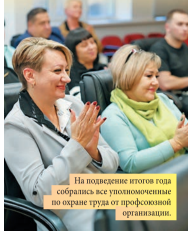
На подведение итогов года собрались все уполномоченные по охране труда от профсоюзной организации.

Напомним, на заводе общественный контроль в области охраны труда осуществляют 28 уполномоченных, которые вносят значимый вклад в создание комфортных и безопасных условий труда в своих подразделениях. За этот год ими было проведено 930 проверок.