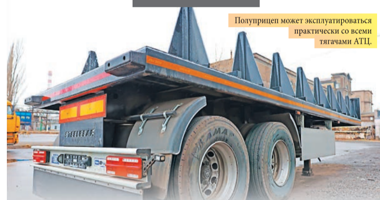
Полуприцеп может эксплуатироваться практически со всеми тягачами АТЦ.