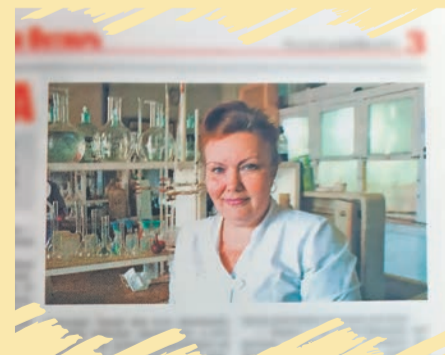
Новые фото – в следующих выпусках.

Узнали, кто изображен на снимке? Пишите на почту o_sizyakina@vmzko.ru Победителем станет автор самого первого полного ответа (нужно назвать ФИО нашей героини и все, что вы о ней знаете – должность, подразделение, этапы трудового пути, награды и т.д.)