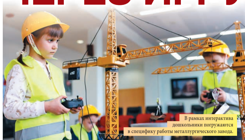
В рамках интерактива дошкольники погружаются в специфику работы металлургического завода.

На «Красном октябре» продолжается реализация специального профориентационного проекта для детей дошкольного возраста – интерактивной игры «Детский металлургический завод». В стартовом мероприятии уже приняли участие более 30 детей сотрудников предприятия в возрасте шести и семи лет.