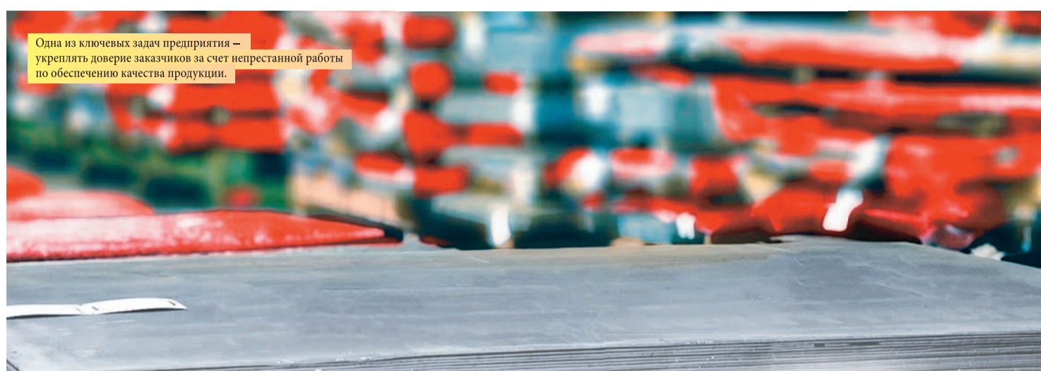
Одна из ключевых задач предприятия – укреплять доверие заказчиков за счет непрерывной работы по обеспечению качества продукции.