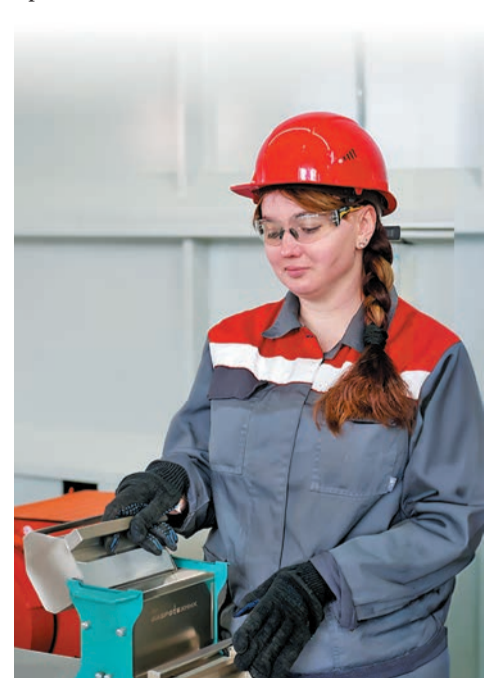
Контроль качества обеспечивается на всех этапах производства – от входных исследований сырья до финальных испытаний готовой продукции.

В планах этого года реализовать инициативу – «контроль глазами потребителя», который будет осуществляться во время отгрузки продукции. Проверка, в каком виде наша продукция отправляется потребителю – внешний вид, упаковка, – мы удостоверимся, что клиент получит не просто качественную, соответствующую нормативной документации продукцию, но и с товарным видом, предвосхищающим его ожидания.