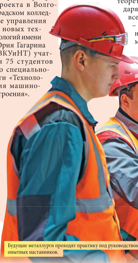
Будущие металлурги проходят практику под руководством опытных наставников.

О бучают будущих металлургов при содействии предприятия с 2023 года как по узкопрофильным специальностям отрасли в рамках договоров сотрудничества, так и по востребованным на рынке труда направлениям программы «Профессионалитет». В рамках федерального проекта в Волгоградском колледже управления и новых технологий имени Юрия Гагарина (ВКУиНТ) учаются 75 студентов по специальности «Технология машиностроения».