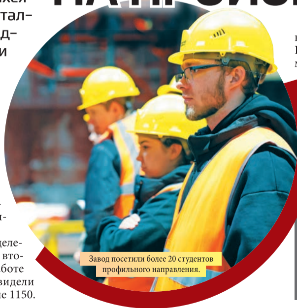
Завод посетили более 20 студентов профильного направления.

Продолжился рассказ о подразделениях уже непосредственно в цехе – второкурсники не только узнали о работе основного оборудования, но и увидели прокат заготовки из слитка на стане 1150.