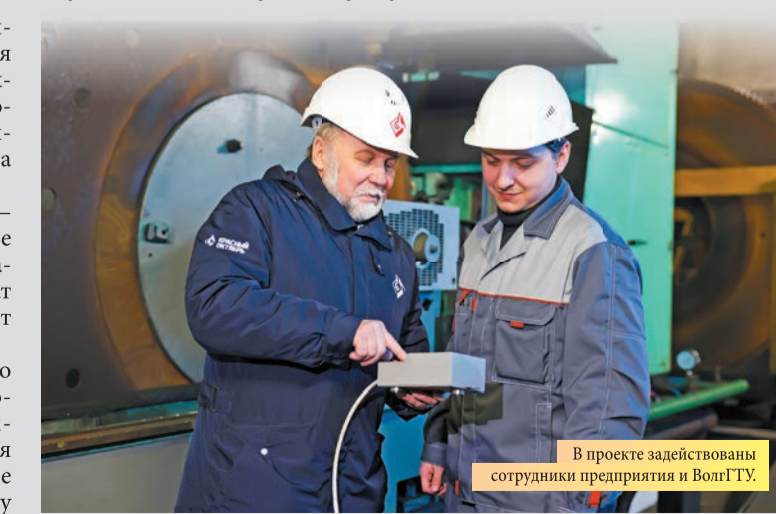
В проекте задействованы сотрудники предприятия и ВольГТУ.

Восстановление изношенного инструмента в мастерской происходит поэтапно: сначала каждый зубец пилы затачивается несколько раз. Далее дисковые пилы отправляются в установку